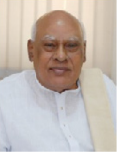
ஆளுநர் திரு. கே. ரோசையா