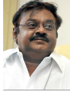
சட்டப்பேரவை எதிர்கட்சித் தலைவர் திரு. விஜயகாந்த்