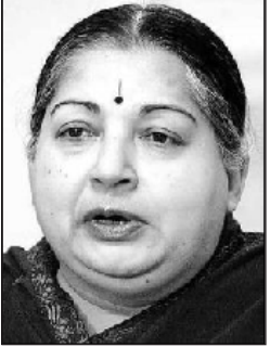
முதலமைச்சர் செல்வி ஜெ. ஜெயலலிதா